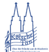
Chor der Kölsche von der Akademie für uns kölsche Sproch e.V.

Kostenlose Tickets unter www.domforum.de/veranstaltungen/unser-programm